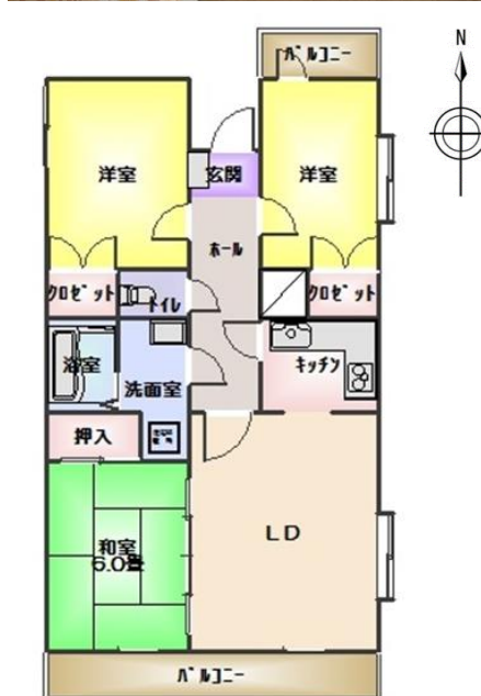
401号室は反転タイプ