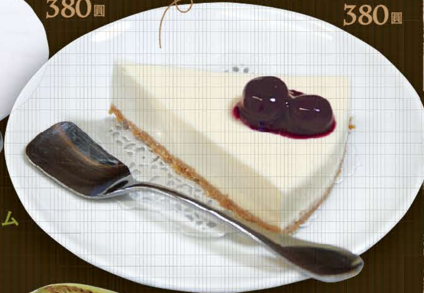
自家製 レアチーズケーキ 毎日手作りのため、 数量限定です。 ご注文はお早めに！ 380円