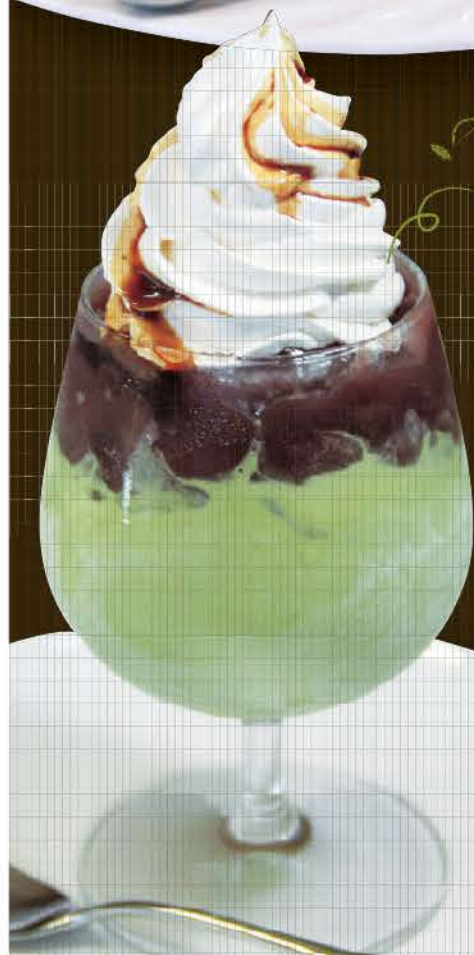
抹茶アイスクリーム 和の味覚を たっぷり召し上げ 480円