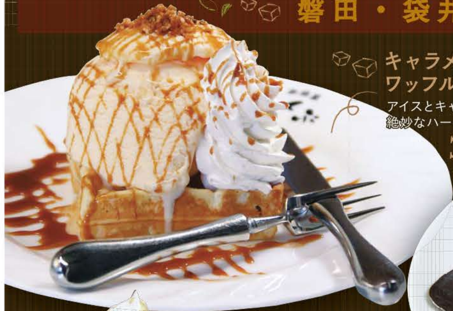
キャラメル ワッフル アイスとキャラメルの 絶妙なハーモニー。 380円