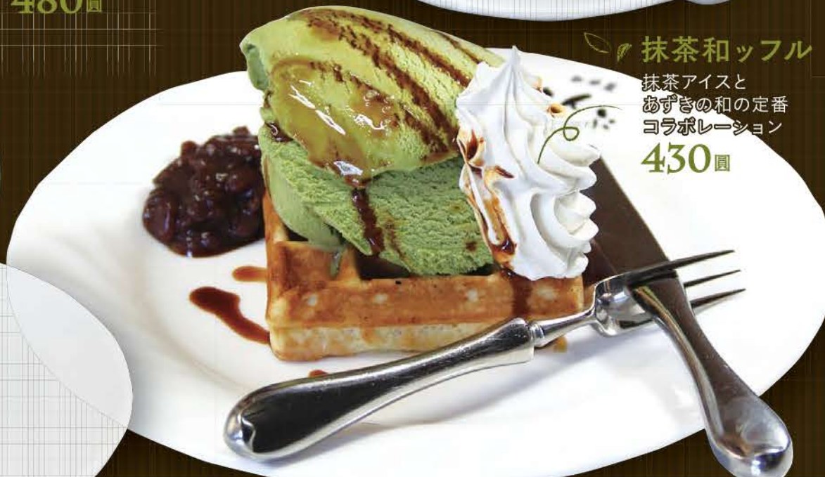
抹茶和ッフル 抹茶アイスと あずきの和の定番 コラボレーション 430円