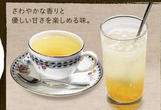
さわやかな香りと 優しい甘さを楽しめる味。