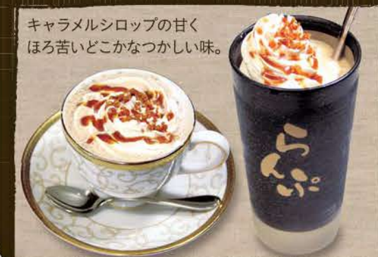
キャラメルシロップの甘く ほろ苦いどこなつかしい味。