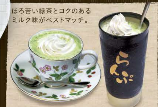
ほろ苦い緑茶とコクのある ミルク味がベストマッチ。